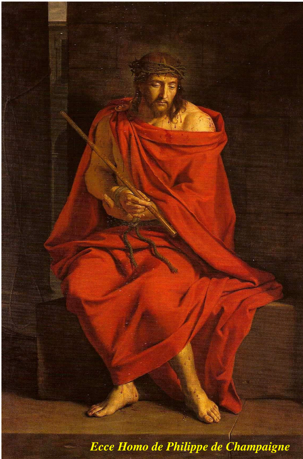
Ecce Homo de Philippe de Champaigne

Dimanche des Rameaux et de la Passion 29 mars 2015