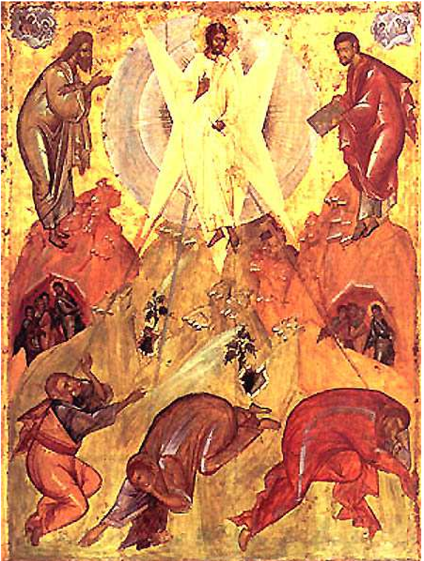
Icône Théophane 15 ème siècle