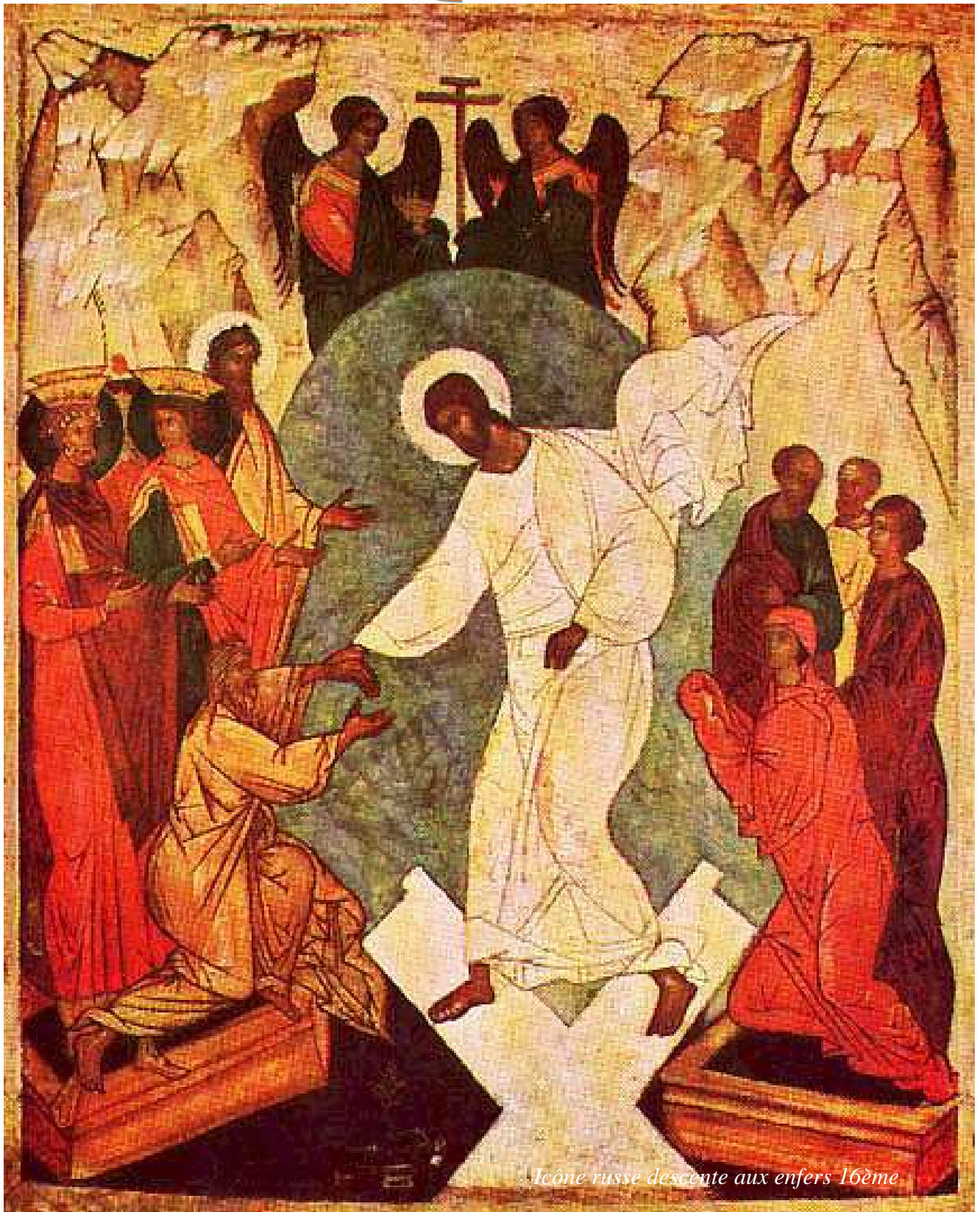
Icône russe descente aux enfers 16ème