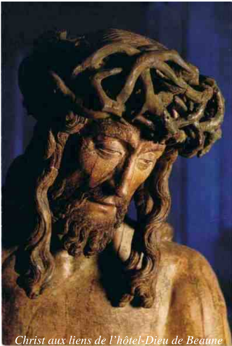
Christ aux liens de l'hôtel-Dieu de Beaune