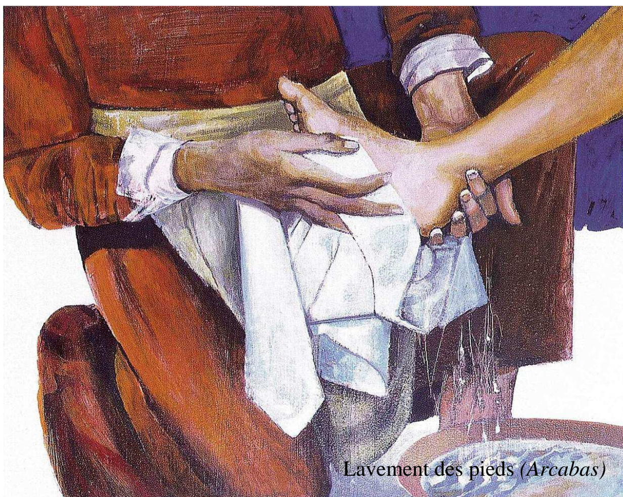
Lavement des pieds (Arcabas)