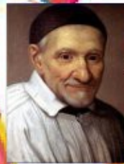
St Vincent de Paul